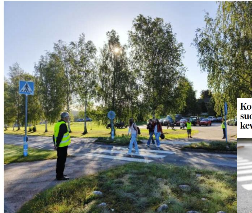
Koulunaloituspäivä sujui rauhallisesti Sauvossa, jossa Lions Club Sauvon aktiivit valvoivat tuttuun tapaan.