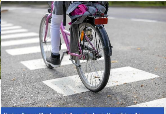
Koulun alkaessa liikenteessä kulkee paljon lapsia. Vaarallisin paikka koulutiellä on suojatie. LUKAS PEARSALL

Kouluteitä turvattiin Viitasaarella – suojateille kaivataan varovaisuutta ja kevyttä kaasujalkaa