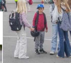
ikuisia vastaanottamaan koulun